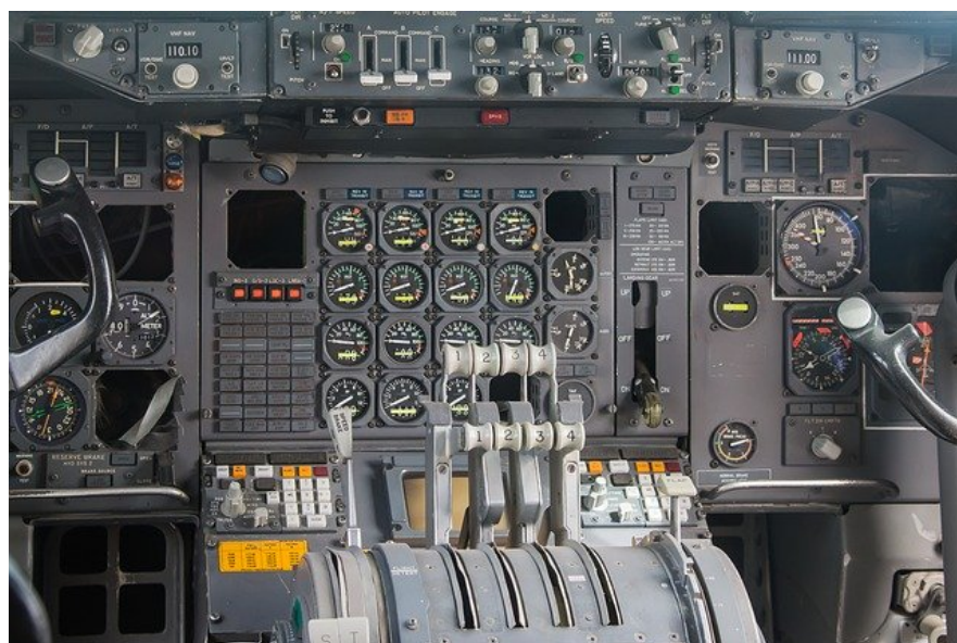
*Michael Schwarzeberger sur Pixabay