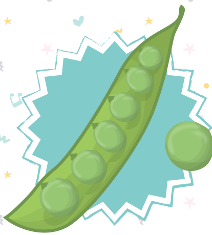
POIS MANGE-TOUT Snow pea