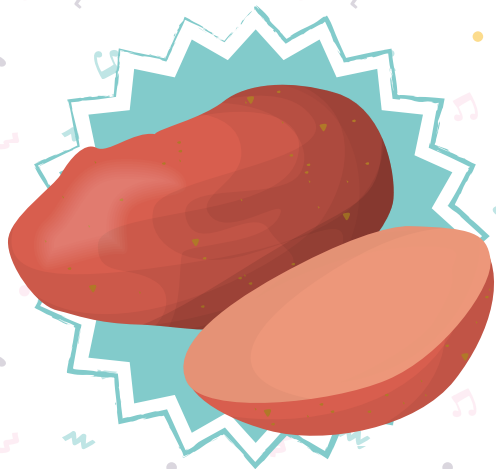
PATATE DOUCE Sweet potato